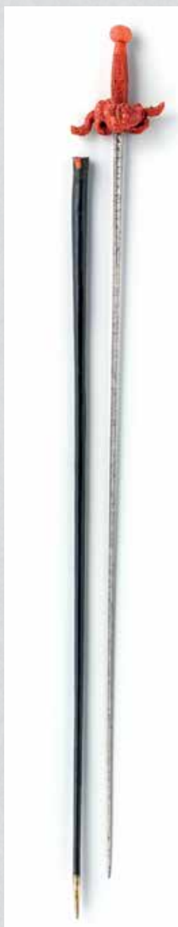
Degen met vierkantige kling en sierlijk gevest van bloedkoraal met zwartleren schede met koperen punt en riemhaak, eveneens van bloedkoraal. Op 13 januari 1676 te Napels geschonken aan De Ruyter door de vicekoning van Sicilië.