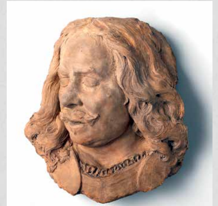
Geboetseerd portret van de gesneuvelde Michiel de Ruyter door Rombout Verhulst, studie voor het grafmonument in de Nieuwe Kerk te Amsterdam (circa 1677-1681).

die eveneens de skyline van Napels verbeeldt. De voorstelling is een andere dan de hier behandelde. Geen enkel Nederlands schip valt op dit doek te bekennen.