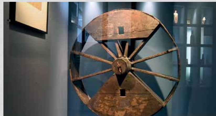
Het touwslagerswiel van de jonge Michiel de Ruyter.

Collectie Koninklijk Genootschap der Wetenschappen in bruikleen aan het Zeewes Maritiem MuZEEum