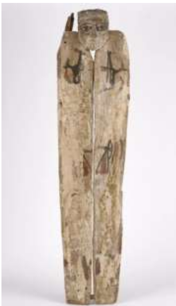
Houten deksel van de sarcofaag van de mummie, geschonken in 1783 door A. Moens (G2135-03).

De publicaties leveren een bijdrage aan de steeds actueler en belangrijker geworden provenance van voorwerpen. Ook voor de Collectie Online werd verdergegaan met onderzoek naar achtergrond en herkomst van volkenkundige voorwerpen in de collectie van het Zeeuws Genootschap. Daarbij wordt voorrang gegeven aan beschermde voorwerpen en ongemakkelijk erfgoed. Er waren dit jaar geen aanwinsten.