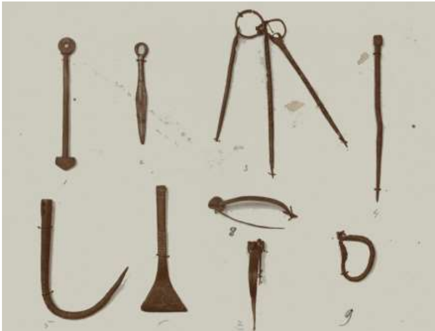
Foto uit ca. 1890 van 9 bronzen voorwerpen door de familie Van Sminia gevonden op het strand bij Domburg. Links beneden het haakje. Zeeuws Archief, KZGW, ZI-III-0474

Op het verlanglijstje voor deze tentoonstelling stond nog een vrij zeldzaam, mysterieus haakje dat ook op de oude foto van de vondsten van de familie Van Sminia staat