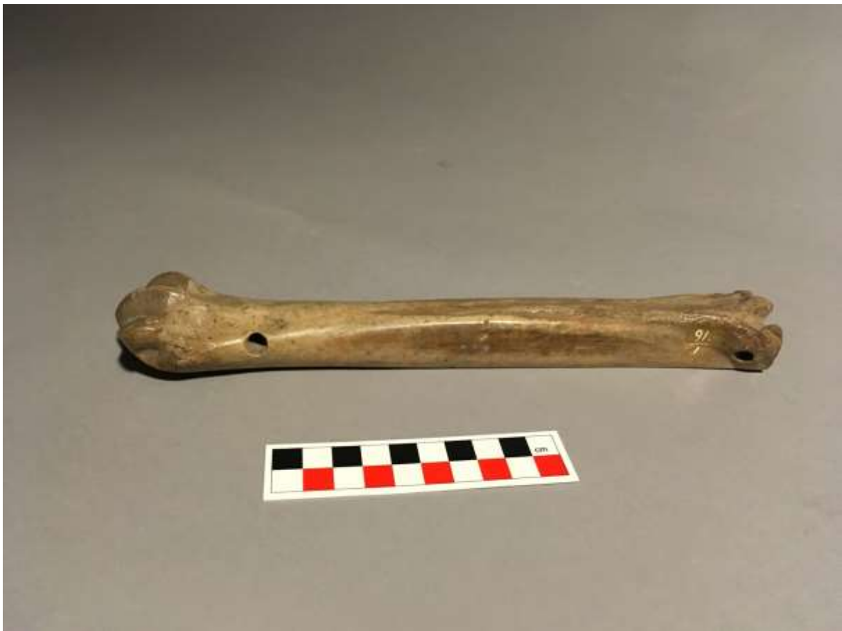
Glis, NAD nr. 91-1

Ten slotte kregen we van het NAD een gave glis (NAD nr. 91-1).