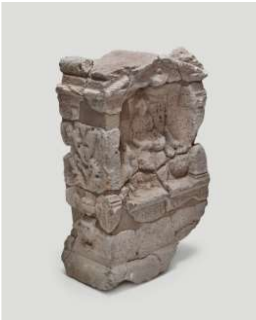
Altaarsteen Nehalennia, nr. G3223

De collectie Nehalenniastenen in het Zeeuws Museumdepot is opnieuw gefotografeerd. Fotograaf Pim Top nam in augustus als eerste de grote votiefstenen voor zijn rekening. Anda van Riet en Mieke van Wijnen legden vervolgens in december alle brokstukken vast. Dit fotograferen was, met uitzondering van enkele van de gaafste stenen, sinds 1955 - voor het boek van Ada Hondius-Crone, The temple of Nehalennia at Domburg - niet meer gebeurd. Opnieuw fotograferen was dus geen luxe, aangezien de fotografie en drukkunst ondertussen sterk geëvalueerd is. In het betreffende boek draaide het bovendien meer om de informatie die alle brokstukken afzonderlijk gaven en waren ze niet met schaal aanduiding en in de juiste verhouding tot elkaar gefotografeerd.