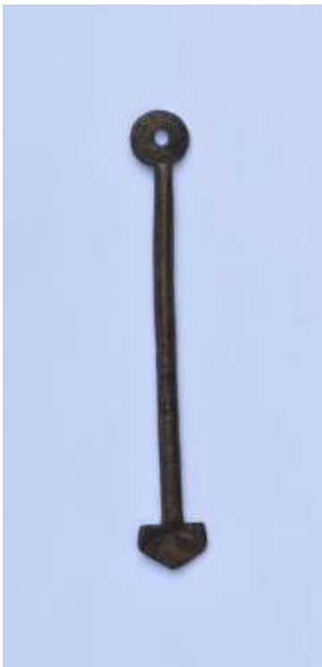
Amuletje. NAD nr. 91.A-12