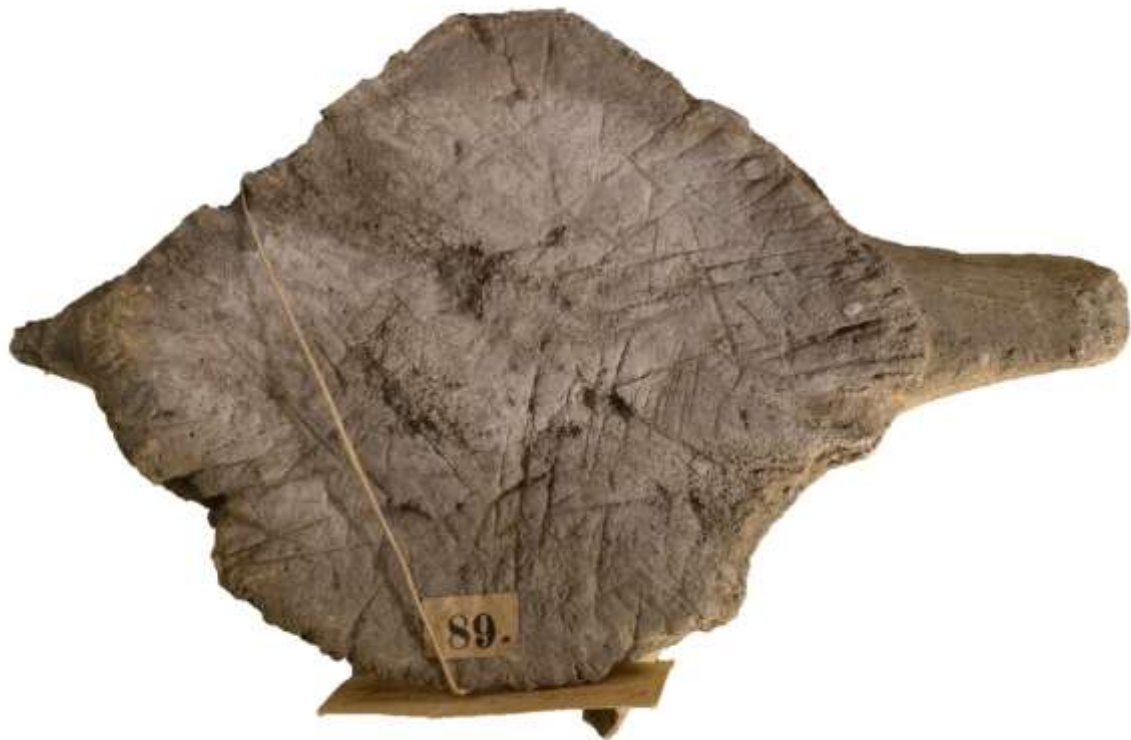
Hakblok van walviswervel, nr. NHG 22019