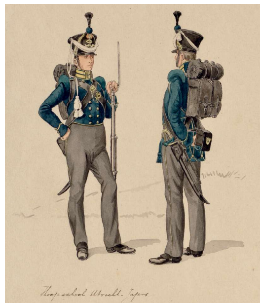
Vrijwillige jagers van de Utrechtse Hogeschool.