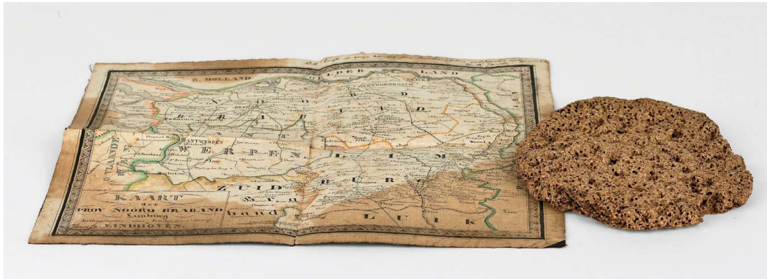
Soldatenbrood met kaartje, G2085j.

trouw karakter. Met ingenomenheid kon hij van die dagen spreken en het metalen kruis, dat zijn borst versierde, stelde hij op hoogen prijs'. 1