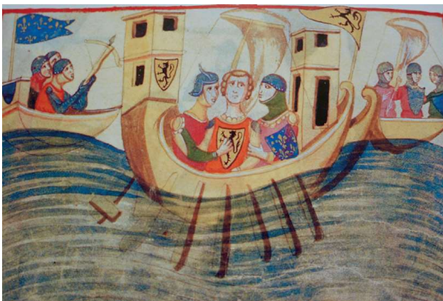
Slag bij Zierikzee in 1304. Tekening uit de 14e eeuw uit de Nuova Cronica van Giovanni Villani.