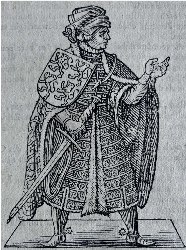
De eerste graaf van Zeeland na de Vrede van Parijs in 1323, Willem de Derde (Henegouwse huis, 1304 -1337).