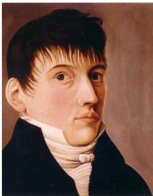
Figure 3: Self portret of Pieter Lankester 73