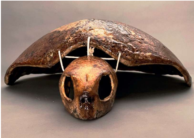
Vooraanzicht van de schildpad uit Zaamslag, foto Anda van Riet.

bij speciale feestelijke gelegenheden in andere landen. Kort daarna verschijnen advertenties in de kranten met aanbod van schildpadsoep. Er komen steeds meer advertenties voor schildpadsoep. Dat hield natuurlijk ook verband met het in de vaart brengen van stoomschepen en de opening van het Suezkanaal in 1869, zodat de tropische dieren Europa sneller konden bereiken. Eerst was schildpadsoep alleen te verkrijgen bij specialiteitenwinkels, later op veel meer plaatsen. Na de Tweede Wereldoorlog was het een gebruikelijk gerecht op de menukaart bij 'de Chinees'.