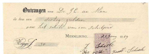
Kwitantie van aankoop van de schildpad uit Zaamslag van J. Scheele door Dr. J.G. de Man

Aanvoer met een schip was mogelijk ook het geval bij de Zeeuwse vondsten in 1889. Het begon met een grote levende schildpad, achtergebleven achter een houten staketsel aan de zeedijk bij Waarde, door A. Kamerling op 3 juni daar aangetroffen. Na opening bleek het dier veel eieren te bevatten. Het rugschild van het dier was een meter lang. De Goessche Courant van 6 juni 1889 maakt tegelijkertijd melding van een vondst van een grote schildpad te Kruiningen, ook een meter lang. Beide dieren werden opgegeten leren we, veel later, bij de vermelding van een andere vondst (Middelburgsche Courant 7 maart 1898). Kamerling had het rugschild bewaard en dat werd door de conservator Dr. J.C. de Man voor het Genootschap verworven (collectienummer NHG621042). Ook bij Zaamslag spoelt een schildpad aan. Deze was dood, wordt geopend en er blijken 52 eieren in te zitten. Dr. J.C. De Man koopt ook dit schild voor het Genootschap en betaalt er maar liefst 30 gulden voor, een groot bedrag in die tijd. Het heeft nu het collectienummer NHG621041. In december spoelen er opnieuw soepschildpadden aan. De Middelburgsche Courant van 11 december 1889 meldt dat er ook op Walcheren (bij Westkapelle) een grote schildpad aangespoeld is van