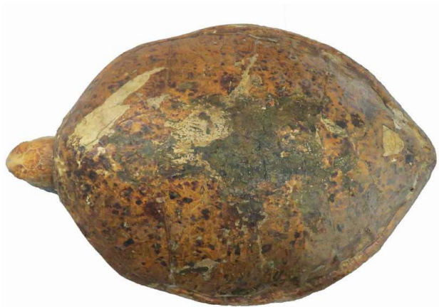
Schild van de schildpad uit Zaamslag voor de restauratie, foto G.R. Heerebout.

dezelfde soort die ook in Zaamslag, Waarde en Kruiningen aanspoelde: Chelonia virides . Het dier is 130 cm lang en weegt 92 kilo. De krant vermeldt dat het dier wel van een zeeschip afkomstig zal zijn. Een dag later meldt de Middelburgsche Courant dat er bij Zoutelande ook nog eens twee grote schildpadden angespoeld waren. Een der dieren werd geopend en zat vol eieren, waaraan een hond een smakelijk ontbijt had. De conservator van het Genootschap Dr. J.C. de Man verwerft deze dieren en schenkt ze aan het Zoologisch Museum te Amsterdam.