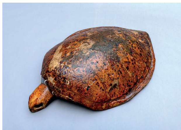
Schild van de schildpad uit Zaamslag na de restauratie.

Op 20 augustus 1895 werd er weer een grote zeeschildpad gevonden, zo meldt de krant De