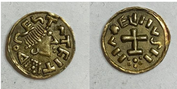
GM3317, een gouden tremises uit Dorestad (de verdwenen handelsplaats bij Wijk bij Duurstede) van de muntmeester Madelinus. Diameter 14,2 mm, 1,18 gram

Een tweede bron van herkomst vormen de collecties van een aantal amateurarcheologen die een grote verzameling hadden aangelegd die zij op enig moment aan het Zeeuws Genootschap schonken.