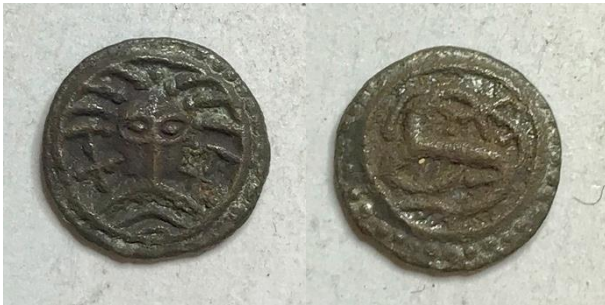
GM3937, een zilveren sceatta van het Wodan-type. Diameter 11,5 mm, 0,81 gram