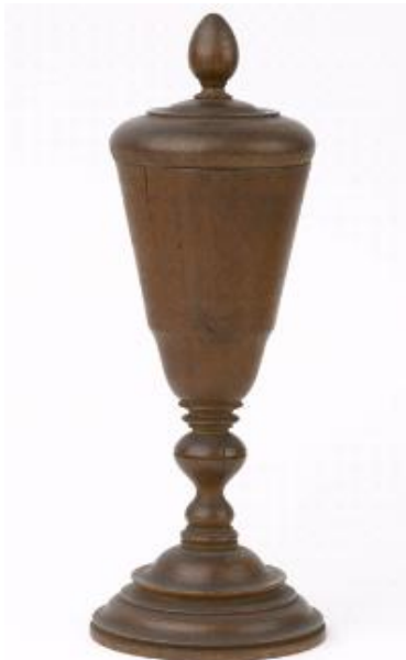
Houten beker met deksel, afkomstig van de kust van Malabar, geschonken door A. Moens in 1780, hoogte ca 28 cm (3600-BEV-Z-67a, zie Collectie Online)