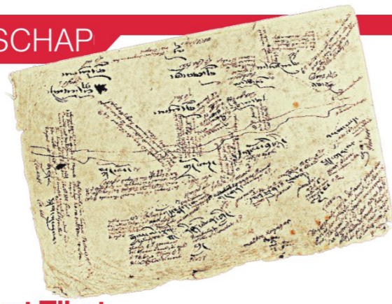
Kaart Tibet ZB | Bibliotheek van Zeeland

Kop van een 'Rhinoseervogel', vogel die op de rug van een neushoorn zit. Geschonken door J. van der Steege, 1790.