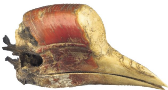
Rhinoseervogel Zeeuws Museum