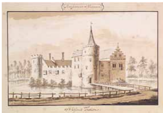
Tekening van de hofstede Hoogkamer te Oud-Vossemeeroogkamer ye Oud-Vossemeer, 18de eeuw. Zeeuws Archief, Zeeuws Genootschap, Zelandia Illustrata II , 2016.

Hij feliciteerde op 6 juni 1672 prins Willem III met zijn benoeming tot stadhouder in zeer vrome termen (RGP 26, Brief nr. 69). In april 1672 werd hij gevolmachtigde naar 's lands vloot (Naamlijst Staten- Gen. 8 apr. 1672). Volgens een brief uit 1667 van raadpensionaris Johan de Witt had de heer van Asperen jarenlang met Cornelis van Vrijberghe in de Raad van State gezeten en 'met hem vrundschap gecontracteert'. Die brief ging over het passeren van raadpensionaris Pieter de Huyberts zoon voor een post in de Raad van Vlaanderen (WHG 3e serie nr. 18. Brieven van de Witt, nr. 383 aan P. de Huybert 1667). Cornelis rapporteerde in 1681 aan de Staten van Zeeland over zijn bemoeienissen met dijken in Vlaanderen (Notulen, p. 209). Hij kocht op 8 maart 1681 de hofstede Hoogkamer met land onder Oud-Vossemeer en een andere hofstede onder Wissenkerke uit de boedel van zijn overleden broer Wilhelm (RAZE 5179). Hij moest daarvoor op de hofstede Hoogkamer in 1683 een hypotheek nemen van 6000 gulden (NA Den Haag, nr. 733, 687). Bij zijn overlijden waren er vier volwassen kinderen, Johan, Anna, Cornelis, Huibrecht en