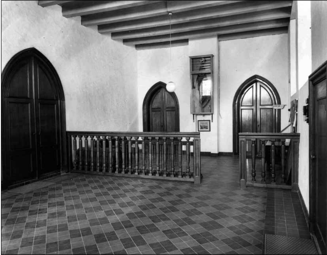
Interieur van de Thoolse vierschaar. Foto van de Rijksdienst voor de Monumentenzorg, 1955.

één periode, 45 was het ambt van baljuw bovendien gecombineerd met dat van dijkgraaf van het Thoolse waterschap.