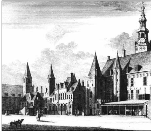
Het Abdijsplein te Middelburg. De zaal waarin de Staten van Zeeland vergaderden bevond zich op de tweede verdieping van het meest rechtse gebouw. Gravure in de Tegenwoordige Staat der Vereenigde Nederlanden naar een tekening van C. Pronk

Niet alleen de katholieke burgemeesters van 1578/79, Bartel Cornelissen en Marinus Anthonissen Colle stonden in Tholen voorlopig buiten spel, hetzelfde gold voor het familie-