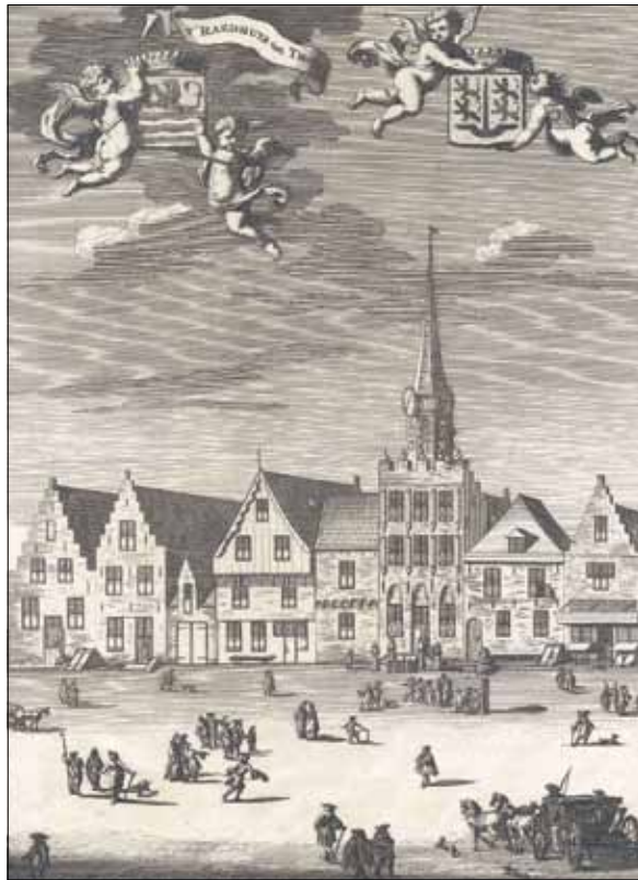
Het stadhuis van Tholen. Gravure in de Cronijk van Zeeland van Matheus Smallegange van circa 1690. Gemeentearchief Tholen.

In het begin van 1796 kwamen de cijfers beschikbaar van de eerste officiële volkstelling die in Zeeland gehouden is. 22 Die volkstelling was nodig geweest voor de eerste, volledig democratische volksstemming in het gewest, dit in het kader van een districtenstelsel, waarin het eiland Tholen een district vormde met twee te verkiezen representanten, één voor het ‘stadsgebied, bestaande uit Sint Philipsland, stad en land van Tholen en Oud-Vossemeer’ (inclusief Vrijbergen) en één voor de rest van het eiland (het zogenaamde ‘platteland’), beginnend met Poortvliet. Daarin staat voor Tholen genoteerd: ‘Tholen en Schakerloo 1695’ en ‘Nieuw-Strijen 79’, met