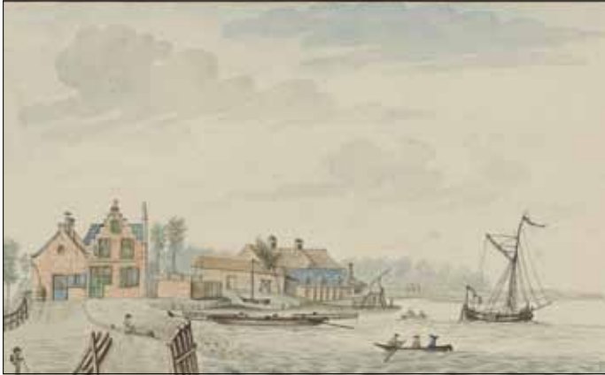
Achttiende-eeuwse tekening van het Thoolse veer, de scheepswerfen en de in 1765 gebouwde zoutkeet.