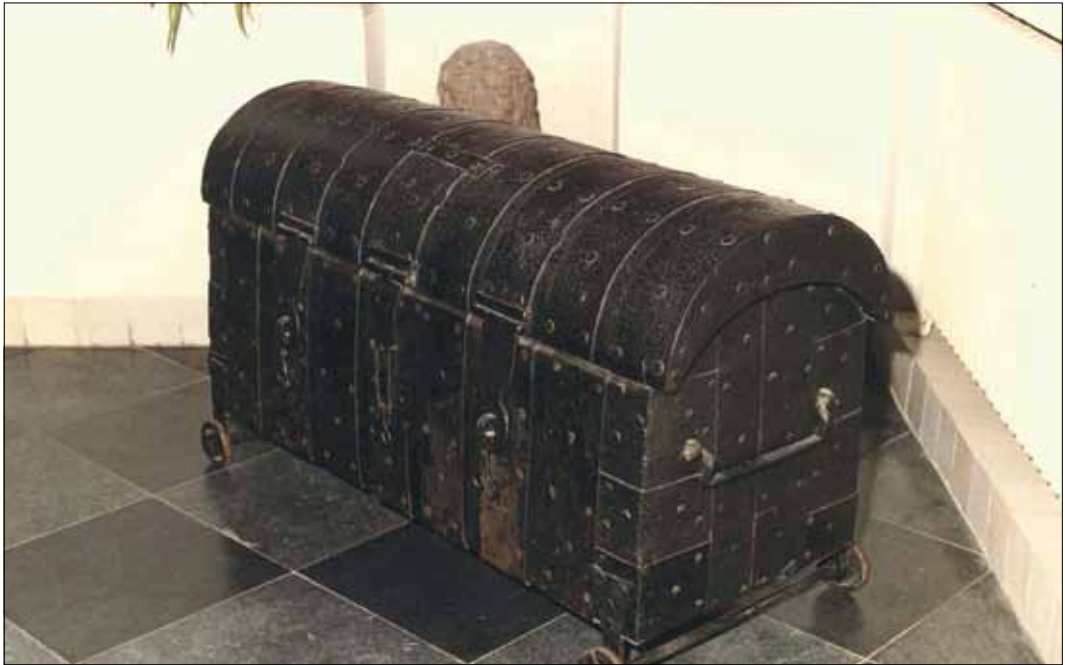
De uit de middeleeuwen daterende Thoolse privilegeekist, aanwezig in het oude stadhuis van de stad.