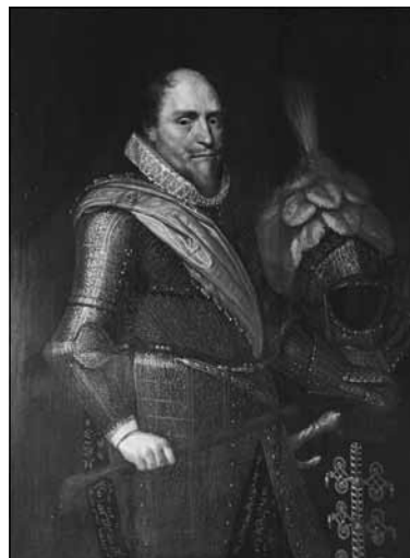
Stadhouder prins Maurits van Oranje. Portret aanwezig in het gemeentehuis van Tholen te Tholen. Atelier v Mierevelt, olieverf op paneel, ca 1625.

De verbolgen prins zelf stelde de zaak aan de orde toen hij een deel van de julivergadering van de Staten van Zeeland bijwoonde en verzocht de staten op 21 juli om een uitspraak te doen over de naar zijn oordeel plaatsgevonden schending van 'de oude gebruiken'. Omdat die van Tholen op deze onverwachte aanval hadden gereageerd door de vergadering te verlaten en ook De Rijke niet aanwezig was, werden commissarissen benoemd om de zaak te onderzoeken.