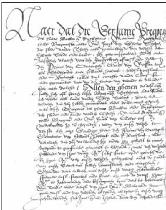
De eerste bladzijde van de Satisfactie uit 1577 waarbij Tholen zich als laatste stad in Zeeland onder het gezag stelde van prins Willem van Oranje, de leider van de opstandige landsdelen. Gemeentearchief Tholen, registerlijst nr. 110.

Voor het deel van Zeeland dat zich in 1572 bij de opstand onder leiding van prins Willem van Oranje had aangesloten, kwam deze ‘Gentse vrede’ maar net op tijd. In mei van dat jaar waren koninklijke troepen er namelijk in geslaagd om na een lang beleg Zierikzee in te nemen, waardoor Walche-