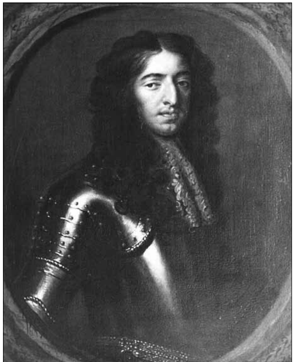
Koning-stadhouder Willem III. Portret aanwezig in het gemeentehuis van Tholen te Tholen. Anoniem, olieverf, eind 17e eeuw.

De twee bijlagen, die met het pamflet zijn afgedrukt, zijn rekesten met adhesiebetuigen aan het adres van de zittende stadsregering. Het eerste is ondertekend door 129 mannen en 19 vrouwen die zich burgers en ingezetenen van Tholen noemen. Het tweede, dat volgens de tekst dateert van 24 oktober 1672, is wat uitgebreider en bevat een korte weerlegging van de punten van de beschuldiging. Onderaan staan de namen van 35 mannen, die zich in de tekst presenteren als gecommit-