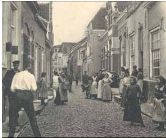
De Kromme Elleboog, gezien vanuit de Dalemsestraat in Tholen. Prentbriefkaart uit het begin van de 20e eeuw.

Een algemene beschrijving van de na de dood van Willem III ontstane situatie valt echter te ver buiten ons kader en we volstaan er daarom mee te vermelden dat de Zeeuwse steden, net als ze in 1672 gedaan hadden, voor hun magistraatsbestelling terugvielen op het voorafgaande regeringsreglement, in dit geval dat uit 1651.