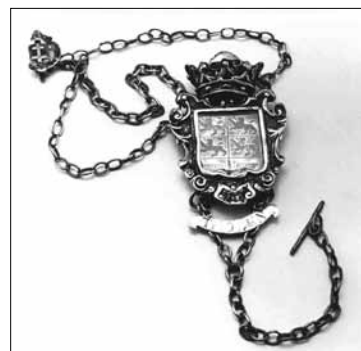
De uit de achttiende eeuw daterende "bodebus" die gedragen werd door de stedelijke gerechtsbode, met de wapens van Tholen en Schakerloo.