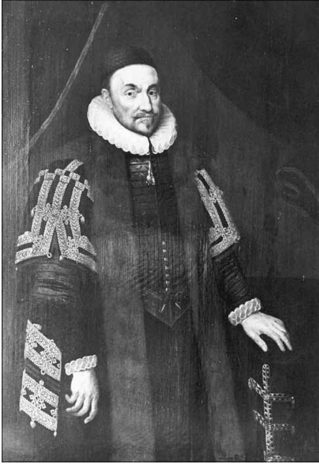
Prins Willem van Oranje, 1533 - 1584. Portret aanwezig in het gemeentehuis van Tholen te Tholen. Atelier v Mierevelt, olieverf op paneel, ca 1625.

ren van zijn voornaamste verbinding met Holland was beroofd en weer het enige steunpunt van de Opstand in Zeeland was geworden. Kort daarna waren echter de onbetaalde koninklijke troepen aan het muiten geslagen en had de Spaanse bevelhebber, Mondragon, de stad weer moeten ontruimen. De muiterij was al snel overgeslagen naar andere onderdelen van het Spaanse leger en sindsdien werd het land geplunderd en onveilig gemaakt door opstandige troepen.