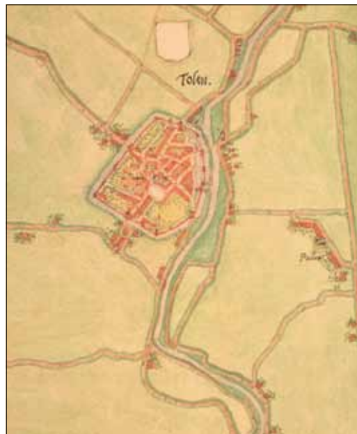
Plattegrond van de stad Tholen getekend door Jacob van Deventer. Netplan, derde kwart 16de eeuw.

tievelijk 1581, 1624 en 1685 zijn gepubliceerd door de afdeling Zeeland van de Ned. Genealogische Vereniging. Volgens deze gegevens stonden er in 1581 226 huizen in de stad, waarvan er minstens vijf ernstig beschadigd en daarom onbewoond waren. De huizen en hofsteden op het platteland en in Schakerloo waren in dit kohier niet opgenomen. De kohieren van 1601, 1624 en 1685 vermelden respectievelijk 335, 390 en 426 huizen en hofsteden in het gehele rechtsgebied van de stad, waarvan respectievelijk 226, 301 en 359 binnen de wallen. Als we 1581 corrigeren voor de vijf huizen die onbewoond waren en (betrekkelijk arbitrair) 99 adressen toevoegen voor Schakerloo en het platteland van Tholen, komen we voor dat jaar op een totaal van 320 adressen. Als we dan vervolgens het aantal bewoners per huis van 1624 als constante maatstaf hanteren, levert dat, samen met het aantal inwoners volgens de census van 1795, de volgende indicatieve reeks bevolkingscijfers op: